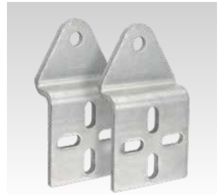
Set à 2 Stück