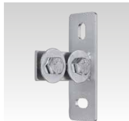
MPC Kopflens, lengte