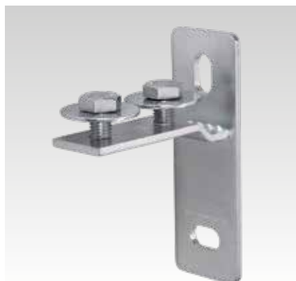
MPC Kopflens, dwars