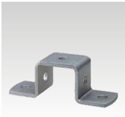
Für Profil 28/30 und 38/40