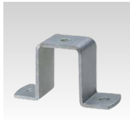
Für Profil 40/60