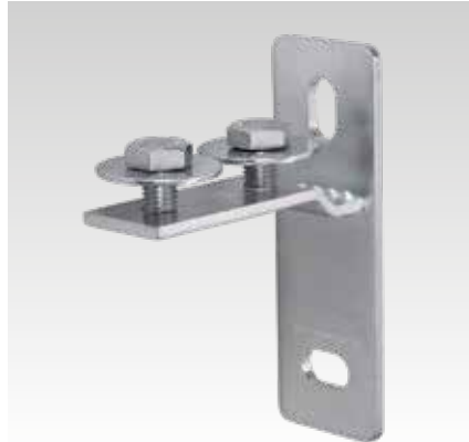
MPC Kopflens, dwars