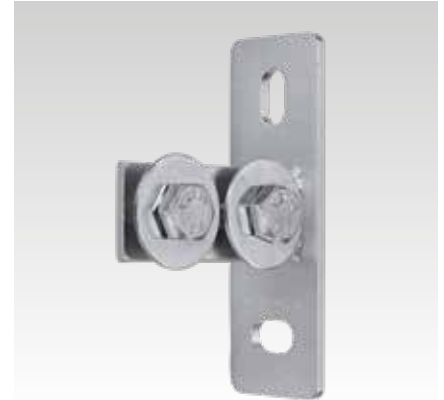
MPC Kopflens, lengte