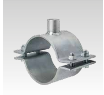
Festpunktschelle 120 x 6