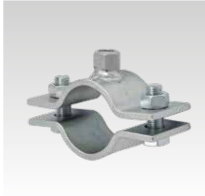
Festpunktschelle 60 x 6