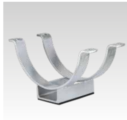
UPG-2 und ISO-Schellen Typ 170 EX - separat zu bestellen