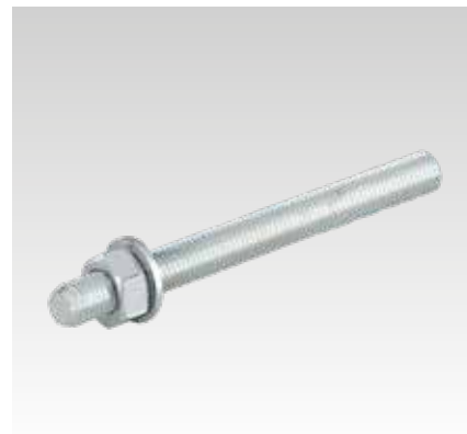
Ankerstange für Voll- und Lochstein Typ VMU-A, Festigkeitsklasse 5.8