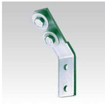
Equerre de montage 45°