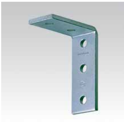
Equerre de montage 90°